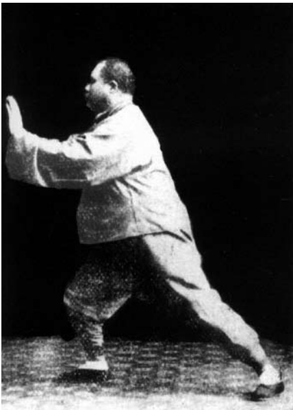
Yang Chengfu, der bekannteste Vertreter der Yang-Familiendition im 20. Jahrhundert Prägnanztyp: Ausatmer Atemtyp: Ausatmer

Liest man verschiedene Taiji-Bücher, so besteht, den Atem betreffend, lediglich Einigkeit über die Bedeutung der Koordination von Bewegung und Atem. Es finden sich aber kaum verbindliche Atem-Anweisungen. Die meisten Bücher versuchen den Zusammenhang von Atem und Bewegung durch Hinweise auf Ausstrecken und Anziehen der Arme, „Öffnen und Schließen“, Heben und Senken aufzuzeigen, bleiben aber ohne weitergehende Konkretisierungen, die es dem Übenden ermöglichen würden, Einzelheiten oder den gesamten Ablauf sinnvoll zu koordinieren. Betrachtet man Taijiquan als Entspannungsübung, dann reicht eine Atmung aus, die die Entspannung fördert, und dann sind die angeführten Beispiele als Hinweise auch ausreichend: langsam, tief und sanft vor allem soll die Atmung im Taijiquan sein. Die Entwicklung von Jin dagegen, der realen Kraft einer inneren Kampfkunst, erfordert einen ganz anderen Gebrauch des Atems – und hier fehlen Anweisungen. So scheint bei Yang Chengfu der Atem keine Rolle zu spielen, denn es finden sich in seinen Schriften (zum Beispiel bei Douglas Wile (Hrsg.): Yang Family Secret Transmissions, 1983) kaum Hinweise darauf, wie zu atmen sei. Zwei