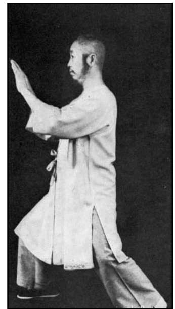
Zheng Manqing, Schüler von Yang Chengfu, änderte dessen Form aber beträchtlich Prägnanztyp: uneindeutig Atemtyp: Ausatmer

Was ist nun aber mit den Schülern, die ihrem Meister exakt folgen, aber nicht dessen Atemtyp entsprechen? Meine Antwort lautet: Übt jemand entgegen seinem Atemtyp, kann er sein eigenes Jin nicht entwickeln. Denn wie sich in der Arbeit meiner TaijiAkademie immer wieder bestätigt, kann die Kraft Jin tatsächlich nur dann entwickelt und eingesetzt werden, wenn der Praktizierende sich seinem Atemtyp entsprechend bewegt und atmet. Es sind die Einatmer, die aufrecht stehen müssen, um an ihre Kraft zu kommen, und die Ausatmer, für welche die Neigung nach vorn dafür entscheidend ist.